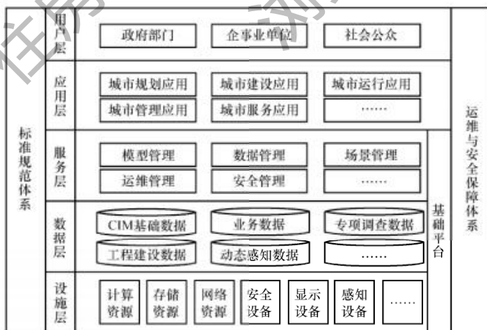
图 3.3.1 总体架构

3.3.1 CIM 总体架构应包括设施层、数据层、服务层、应用层、用户层以及标准规范体系、运维与安全保障体系（图 3.3.1），并应符合现行国家标准《智慧城市 公共信息与服务支撑平台 第 1